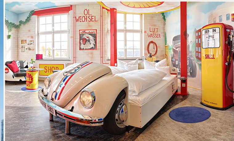
V8 - THEMENZIMMER