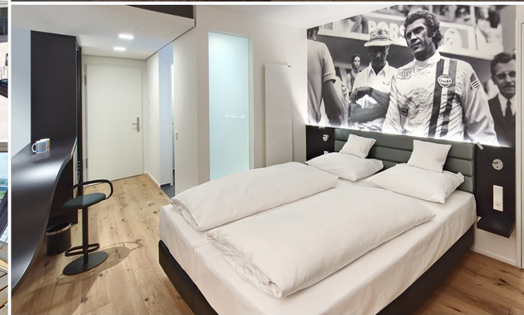
V6 - DESIGN-DOPPELZIMMER