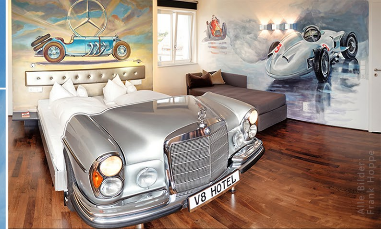
V12 - MERCEDES SUITE