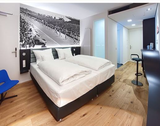
V6 - Design-Doppelzimmer