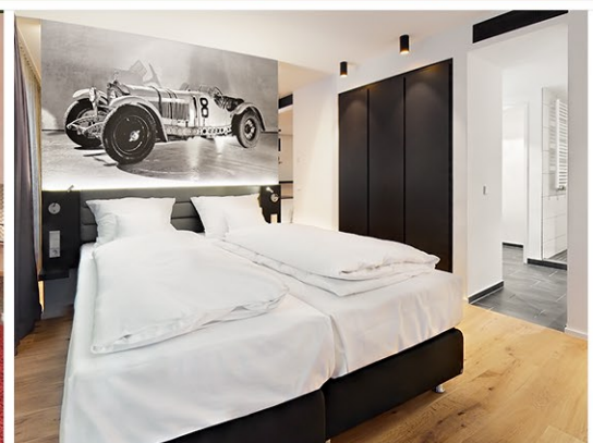
V10 - Service Appartements