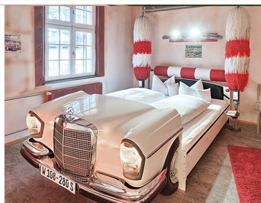
V8 - automobile Themenzimmer