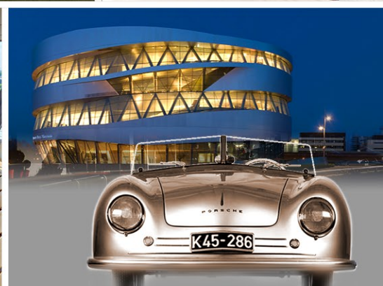
V12 - Mercedes Suite